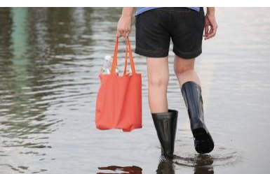
Ochrona przeciwpowodziowa Chroni budynki i krajobrazy

Dla miast, straży pożarnej, wojska, firm i właścicieli domów