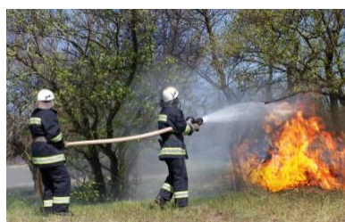
Zbiornik wody na wypadek pożaru Spiętrzanie wody do użytku w odległych pożarach lasów lub budynków